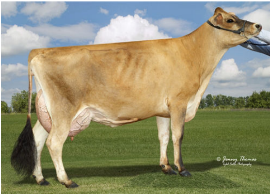
PROGENESIS CYRUS BUTTON GRANDDAM